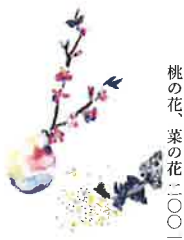
桃の花、菜の花二〇〇一