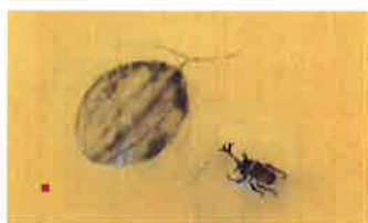
西瓜カブトムシ二〇一三