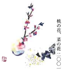
桃の花、菜の花二〇〇一