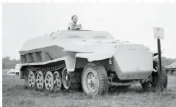
アメリカ・アバディーン戦車博物館取材の田宮会長 1972年