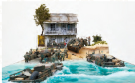
ミリタリーミニチュア情景作品 製作 葛瀬 翔