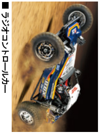
■ラジオコントロールカー