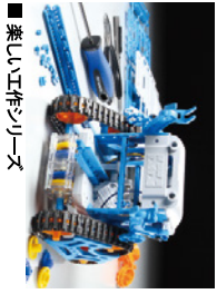
■楽しい工作シリーズ