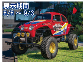
展示期間 8/8 ~ 9/3

〒039-2501 青森県上北郡七戸町字荒熊内67-94 TEL.0176-62-5858 FAX.0176-62-5860 https://www.takayamamuseum.jp/