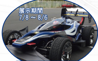
1/1スケール ミニ四駆もやってくる 「エアロアバンテ」展示