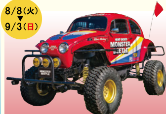
モンスタービートル