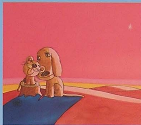
やさしいライオン