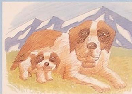
セントバーナードとたびひと