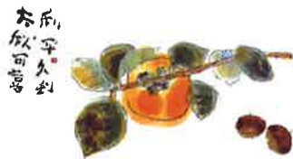
大秋可喜 平久利二〇一五